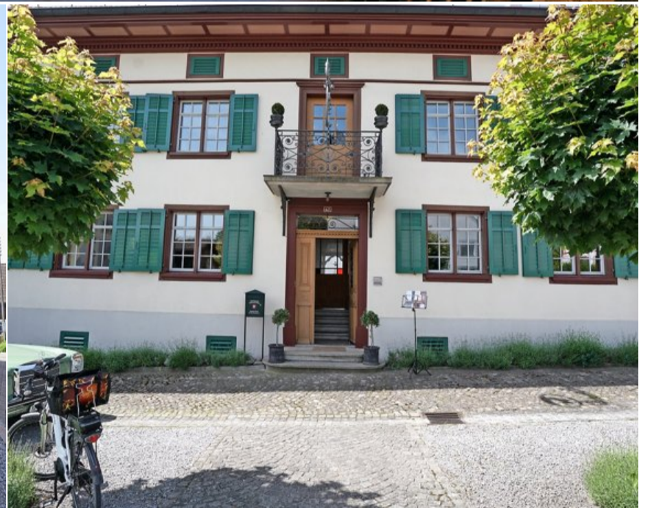
Sowohl in der Scheune (oben und unten links) als auch im Rössli (unten rechts) wurde viel von der ursprünglichen Substanz erhalten.